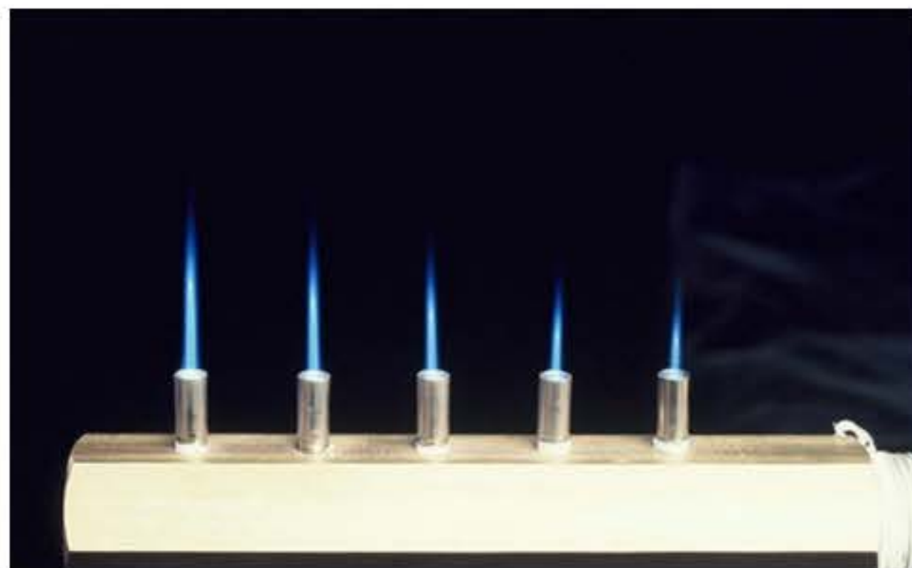
【A 3 型単孔ピアンバーナ】

ガス、エアーの予混合型バーナです。シャープな長針状の火炎が得られる為、ガラス製品の加工やろう付けハンダ付けなど、幅広い用途に使用できます。接続方式、外形寸法によりA 1 型、A 3 型の2タイプの仕様があります。